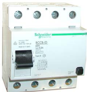
HPFI afbryder Klasse B til frekvensomformere

Mætning af sumstrømsspolen: det vil betyde, ingen automatisk udkobling, selvom der opstår en permanent og farlig lægstrøm i installationen, til fare for personer samt risiko for brand i bygninger. Til trods for, at vi i Danmark har få personskader om året forårsaget af mætning eller fejl i fejlstrømsafbrydere, er antallet af brande knap 2.500 pr. år*, hvor branden er startet i den elektriske installation. *) Kilde: Sikkerhedsstyrelsen; statistik elbrande 2008.