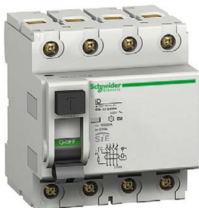
HPFI afbryder type Si til grupper af PC'er

Når man installerer en AC/DC afbryder af klasse B, kan man ikke tillade sig at sætte en afbryder af type A/AC foran - det vil sige, man må ikke blande installationen. Det skal forhindres, at der kommer til at løbe en jævnstrøm igennem de normale HPFI-afbrydere, da de jo så ikke vil være virksomme. Derfor skal alle afbrydere af klasse B forbindes øverst i installationen. Hvis man har et miks af forskellige brugsgenstande, og det er for dyrt at lægge installationen om, skal man indsætte afbrydere af klasse B i en lige linie fra brugsgenstanden/forbruger til indgang.