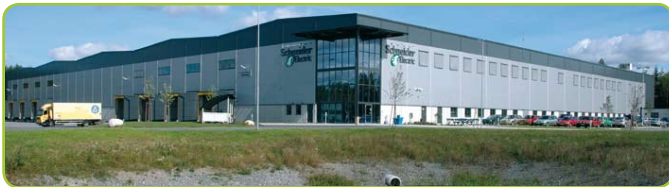
Schneider Electric's distributionscenter i Örebro i Sverige.